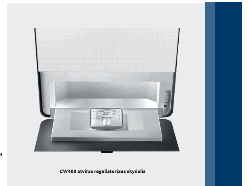
CW400 atviras reguliatoriaus skydelis

Dėl naujoviško reguliatoriaus jutikliniame ekrane galima patogiai valdyti pagrindines šildymo funkcijas. Nulenkiant CW400 reguliatoriaus skydelį, paspaudus mygtuką, galima pradėti eksploatuoti.